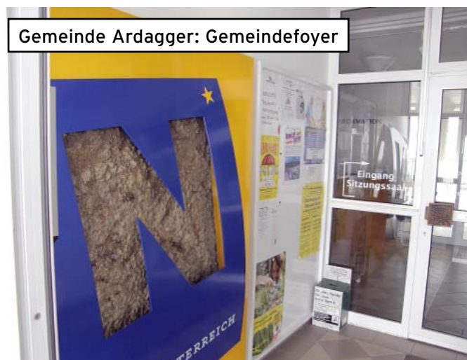
Gemeinde Ardagger: Gemeindefoyer