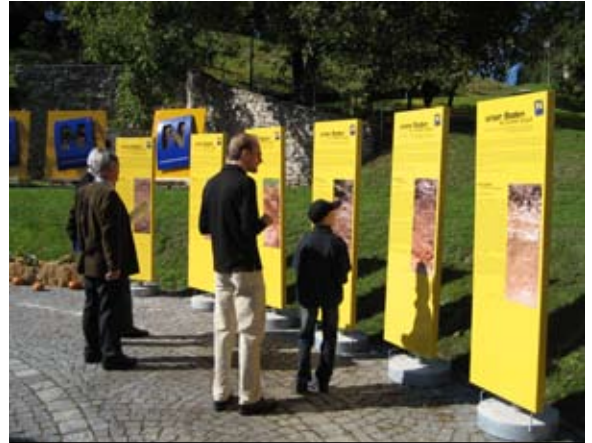
Vor der Montage: Präsentation von Begleittafeln in Betonsockelständern

Da die Begleittafel das gezeigte Bodenprofil erklärt, sollte sie in unmittelbarer Nähe zum Bodenzeichen aufgestellt werden.